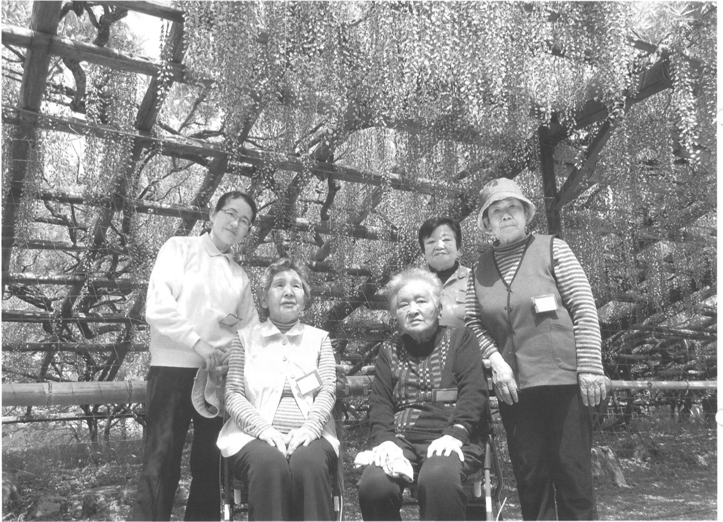
ふれあい通所サロンで“藤”を見に行きました。

発行／ 勤労福祉会館内 日野町社会福祉協議会 〒529-1602 滋賀県蒲生郡日野町河原一丁目1番地 TEL 0748-52-1219・1920 FAX 0748-52-2009