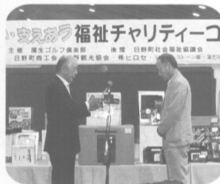
▲蒲生ゴルフ倶楽部 様

また、同倶楽部の会員で組織されている、蒲生協友会様より、車椅子を善意銀行へご寄付いただきました。