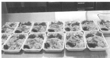
▲安部居・歳末支え合い事業