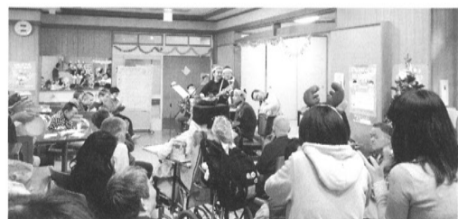
▲わたむきの里作業所クリスマス会

学童保育所や作業所で開催される年末事業へ、より一層あたたかい事業となるよう、助成しました。