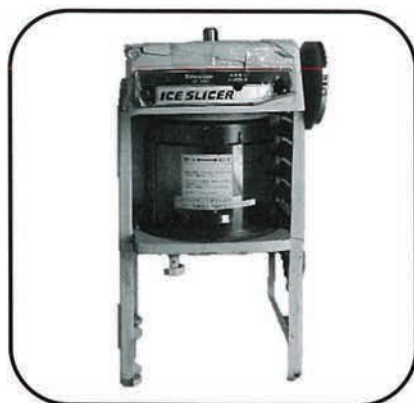
かき氷機 ・ブロック氷用 ・バラ氷用