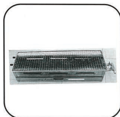
やきとり用コンロ