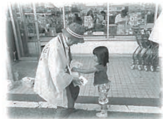
▲赤い羽根街頭募金の様子