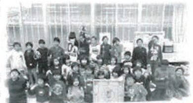
▲西大路学童保育わたムッキークリスマスおたのしみ会の様子

学童保育所や作業所で開催される年末事業へ、より一層あたたかい事業となるよう、助成しました。