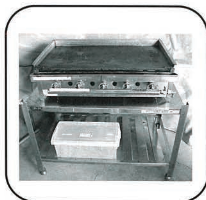
鉄板（コンロ・足付） 75cm×45cm